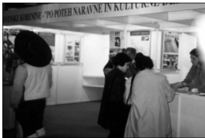
Utrinek z razstave.