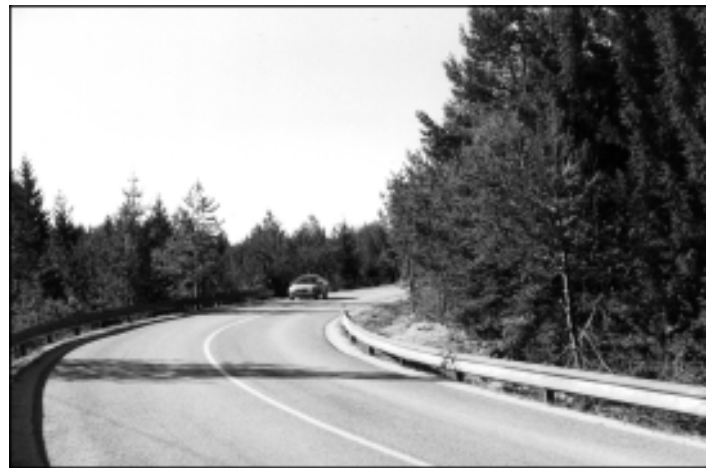
Ali ste že opazili, da se pripeljete z Bloške police na .Bloke po gozdu?