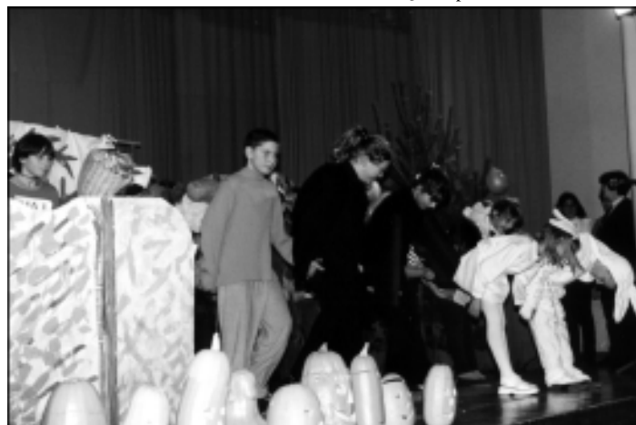
Končano je, sledi samo še priklon.

Zakaj navdušeni? Ker smo bili prej bolj ali manj prepuščeni sebi v izbiranju beril v tujem jeziku in včasih nekoliko nerodni pri izbiri. Epicenter pa nam je ponudil bogato paleto najrazličnejših knjig, dostopnih skorajda vsem učencem na določeni stopnji znanja tujega jezika. Že takoj na začetku sem ugotovila, da so učenci novost hitro in lepo sprejeli. Z veseljem so se lotili privlačnega branja in si tako na zanimiv in zabaven način bogatili besedni zaklad. Predvsem pa so se znebili strahu pred "knjigo v tujem jeziku". Tudi nagrade so zanimive in privlačne. Prav vsak, ki mu uspe prebrati vseh pet knjig za bralno značko, prejme ob zaključku šolskega leta priponko. Učenci, ki na tekmovanju dosežejo več točk, osvojijo tudi diplomo, tisti najboljši, ki dosegajo izjemno dobre rezultate, pa poleg priponke in diplome prejmejo tudi knjigo. Z veseljem povemo, da imamo