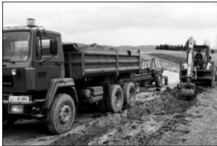
Dela na cesti Ravnik - Škufče

O vojaških objektih v Velikih Blokah smo vodili že kar nekaj aktivnosti. Vse pobude, ki smo jih posredovali na ministrstvo za obrambo, so žal naleteli na gluha ušesa. Upali smo, da bo država objekte in zemljišča, ki jih ne potrebuje, odstopila v upravljanje občini Bloke. Ministrstva, ki so zemljiško-knjižni lastniki, pa so se začela obnašati tržno. Lastnino, ki je ne potrebujejo, so pripravljeni odprodati po tržni ceni. Tako smo pred kratkim dobili pismo informacijo, da bo sprožen postopek odprodaje bivšega doma