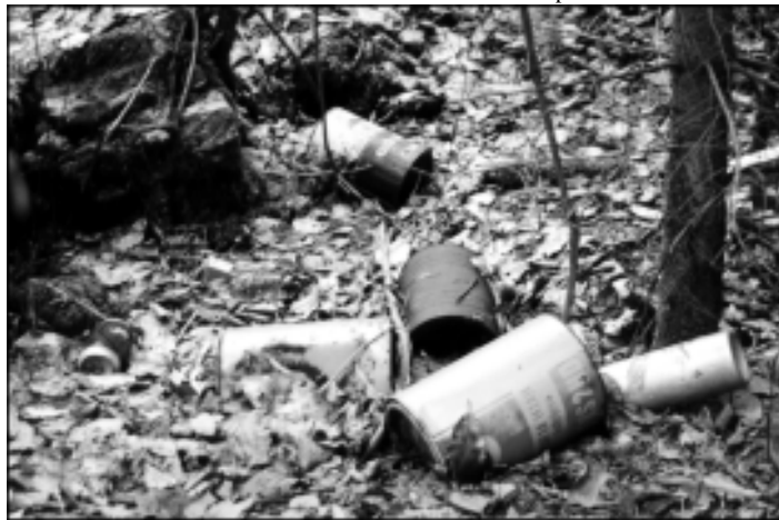
Gozd ni smetišče.

občinskem svetu. Čeprav nisem strokovnjak za kmetijstvo, pa vendar menim, da bo moč ohraniti vsaj srednje velike in velike kmetije. Srednje kmetije bodo morale imeti še neko dodatno dejavnost, kot je kmečki turizem, domača obrt in podobno. Podpirati pa je potrebno tudi projekt velike kmetije po principu velike količinske pridelave. V obeh