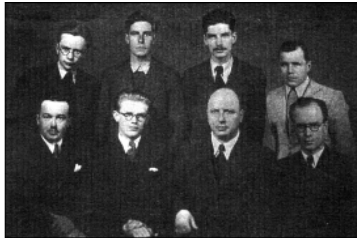
Člani literarnega kluba