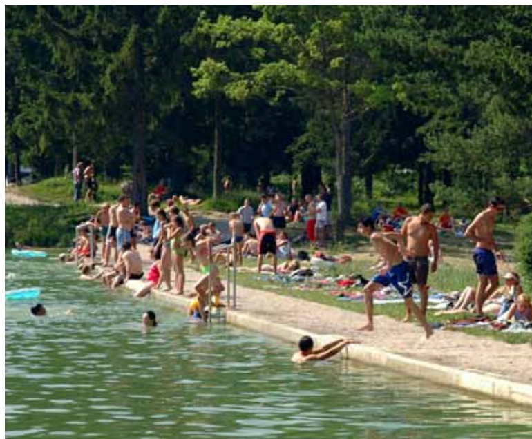
Destinacija Bloško jezero je po prenovi zaživela