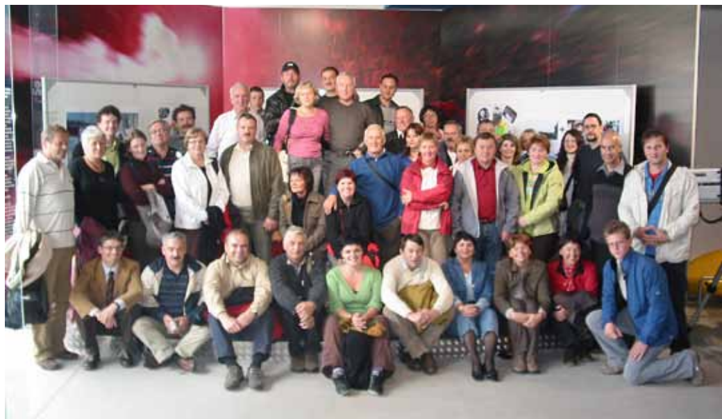
Bločani v Mürzzuschlagu