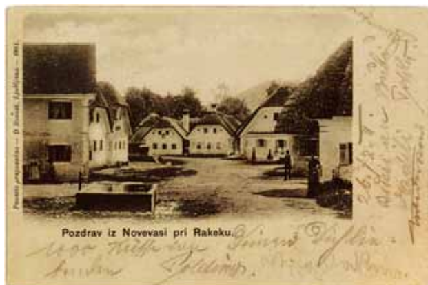
Fotografija Nove vasi iz leta 1901

M arsikdo bi se strinjal, da so nekoč nujno potrebna vaška korita danes pomemben del kulturne dediščine. Najstarejši vodnjak v Novi vasi je bil zgrajen leta 1863 in stoji med »Janezkovo« in »Pakiškovo« domačijo. Drugi vodnjak je nekoliko mlajši, iz leta 1892, stoji nekaj hiš naprej, pri »Mestkovih« in »Srebrnakovih«. Voda je v »štirne« neprekinjeno tekla iz zajetja Sušica, je pitna, sama korita pa so zanimivost za prišleke, saj predstavljajo pomembno dediščino kmečkega življenja. Zadnje čase se marsikateri mimoidoči sprašuje, zakaj vodnjaka usihata. Čas teče, Novovaščani pa upajo, da se bo voda le vrnila po starih poteh v »štirne«.