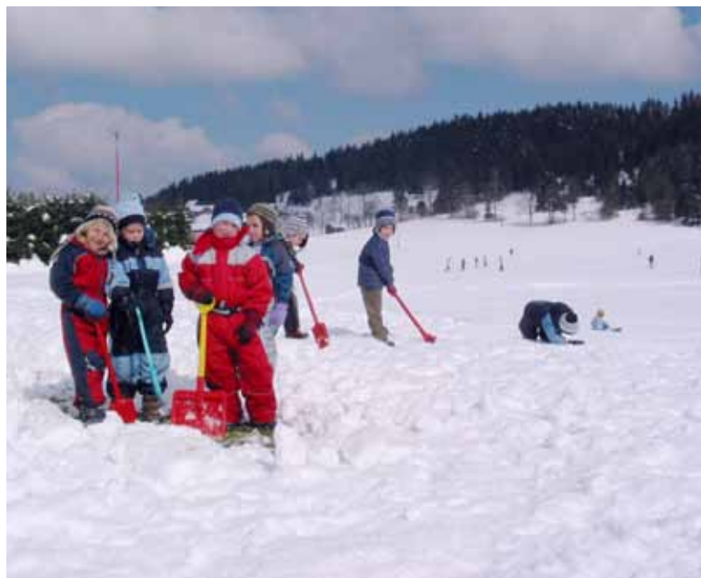
Z ustanovitvijo občine smo zaustavili trend upadanja prebivalstva