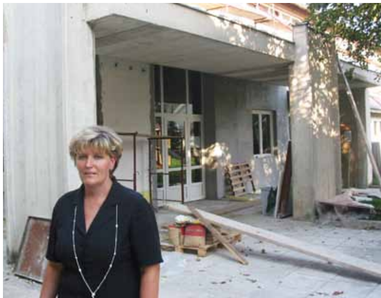
Osnovna šola je bila potreba izboljšav in posodobitev

sodobne medicinske opreme in pohoštva. V prenovljeni zdravstveni postaji je vsem uporabnikom omogočena kvalitetna zdravstvena oskrba, kar je za kvaliteto življenja na Blokah izjemnega pomena.