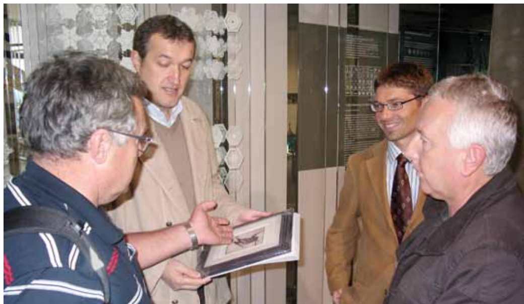
Županu Mürzzuschlaga (2. z leve) in direktorju muzeja smo podarili grafiko bloškega smučarja