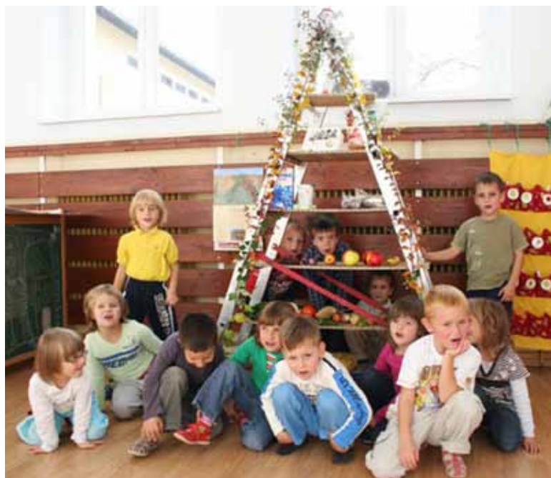
Vrčevski otroci ob zanimivo izdelani prehranski piramidi iz lestve

Učenci prve in druge triade so spoznavali tudi navade, ki ohranjajo zdravje. Naučili so se, kaj ohranja njihovo zdravje in kaj jim lahko okvari zdravje. Peto šolsko uro pa so se zbrali na skupni predstavitvi. Poizkusili so tudi izdelke, ki so jih spekli ali pripravili različni razredi. Na voljo so nam bili pirini piškoti, sadna nabodala in različni namazi –