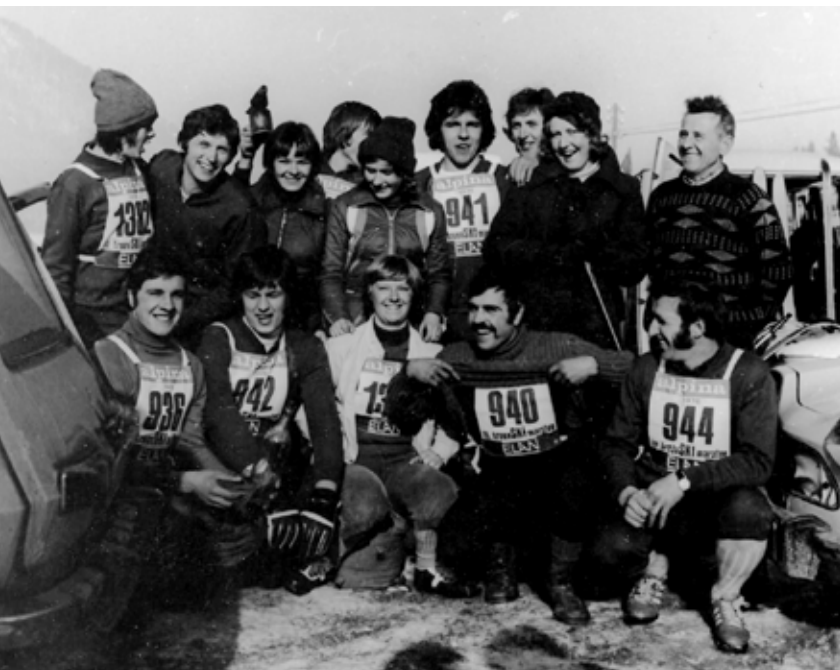
Že v »črnobelih« časih smo uživali na Trnovskem maratonu

A navkljub temu naj prevlada bloška trma. Skupno število vseh članov se približuje številki 80. To pa je množica, ki lahko premaga tudi vreme. Po zaključku zimske sezone