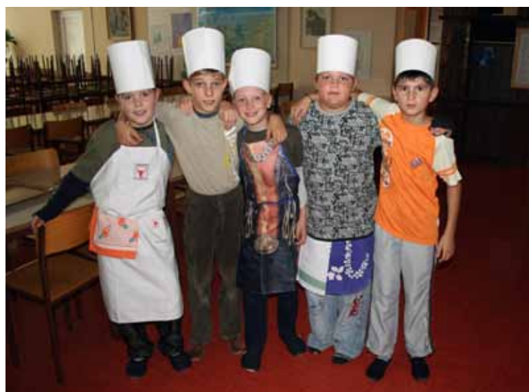
Najbolj nam je teknil kefir s sadjem