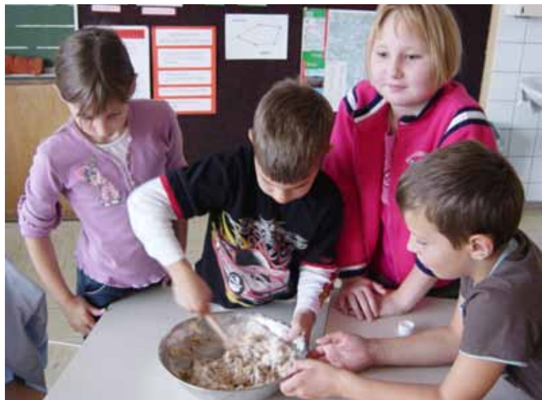
Tilen bo najprej vse sestavine premešal s kuhalnico.