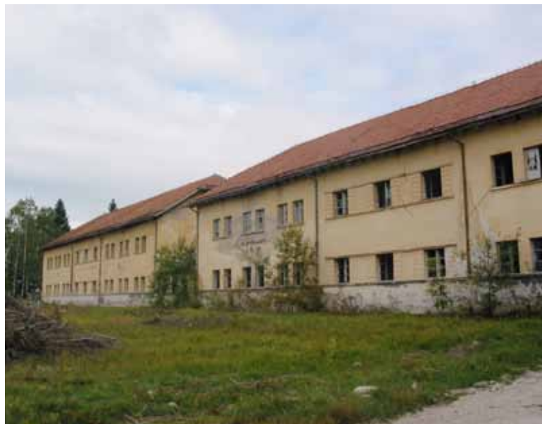
Odslej bodo tu domovali bloški podjetniki in obrtniki