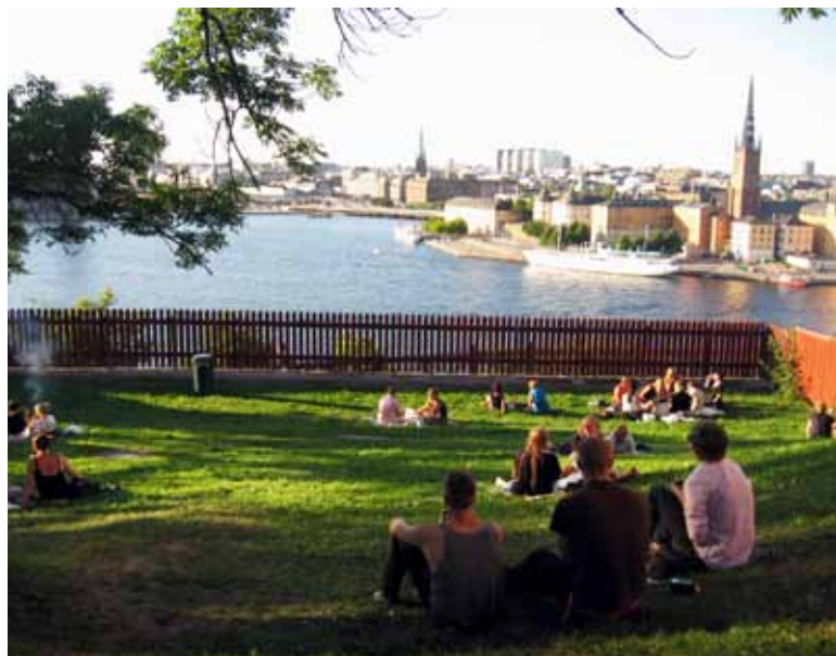
Popoldanski piknik in kramljanje v parku

Zjutraj pridem na vkrcališče in srečujem kup ljudi z vrečami in vrečami hrane. Hm, si mislim, so pa požrešni. Kot da jih bo dvourni vožnja izčrpala in kot da ne bo nikjer nobene trgovine. Oh, so smešni ti ljudje. Vožnja je potekala mirno, sem in tja smo se ustavili in odložili po-