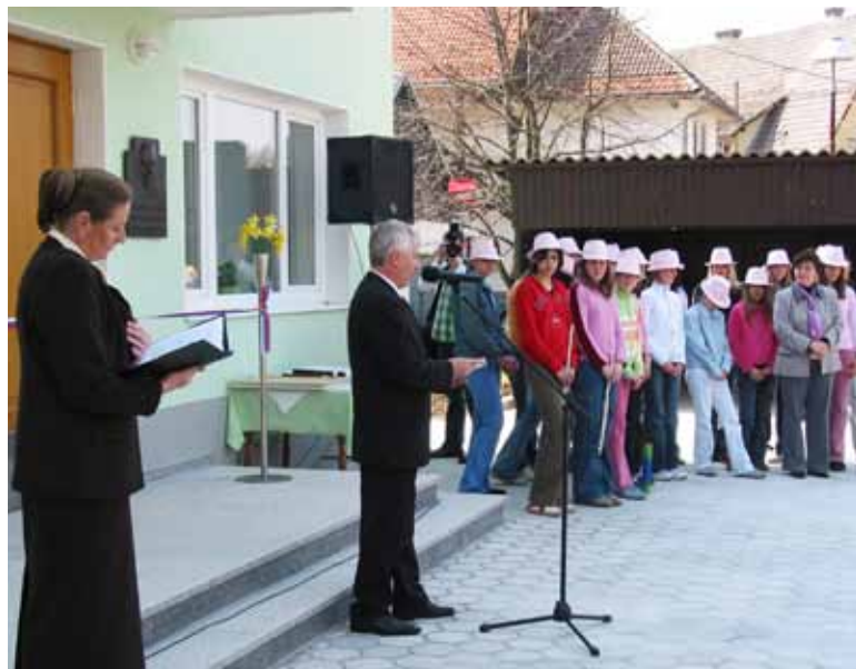
Otvoritev prenovljene zdravstvene postaje dr. Božidarja Lavriča

Vidni rezultati naše občine pa so opogumili tudi druge investitorje. Z aktivnim sodelovan-