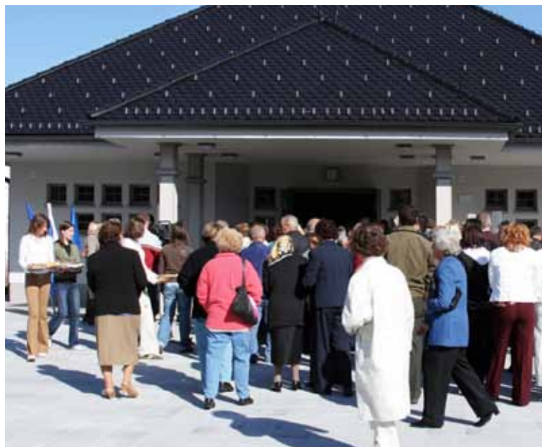
Lani je bila dograjena mrliška vežica