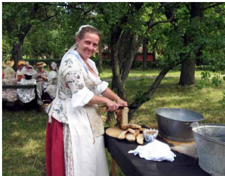
Tradicionalna pojedina ljubiteljev stare švedske kulture

Ko tako pomislim na vse skupaj, si mislim, da je Volčje jezero z brunarico in nekaj sto metri nasutega peska