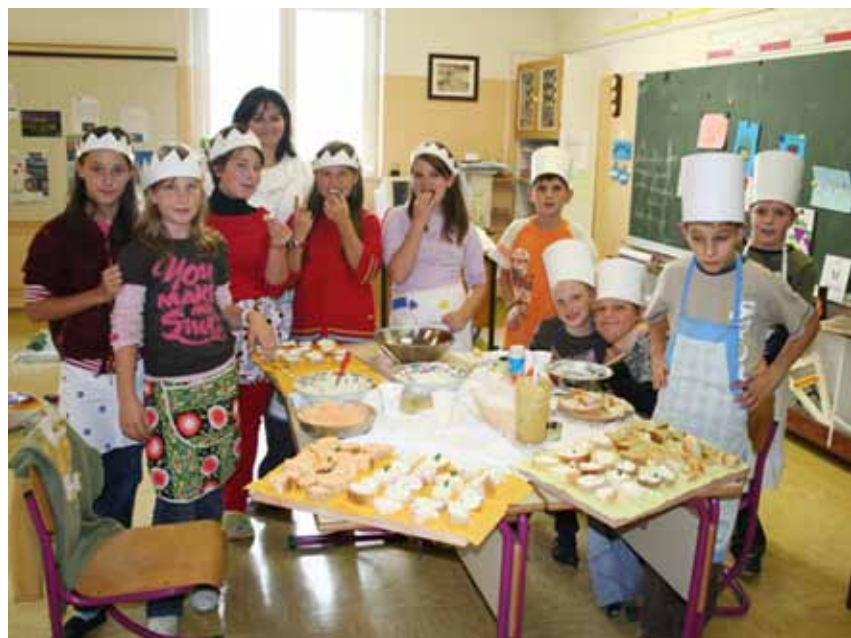
Učenci 5. r. ob mizi, polni okusnih namazov, ki so jih sami pripravili