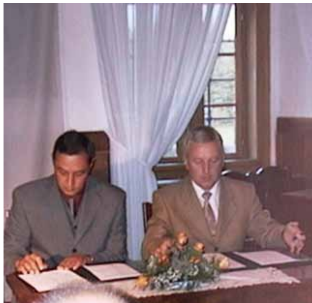
1998: izločitev iz občine Loška Dolina

devanj se je v teh letih navedena infrastruktura pomembno izboljšala in postala dostopna prebivalcem v večini naselij. Z aktivnostmi bomo nadaljevali tudi v prihodnjih letih vse z namenom, da bi v bodočnosti vsem Bločanom zagotovili enake pogoje za življenje.