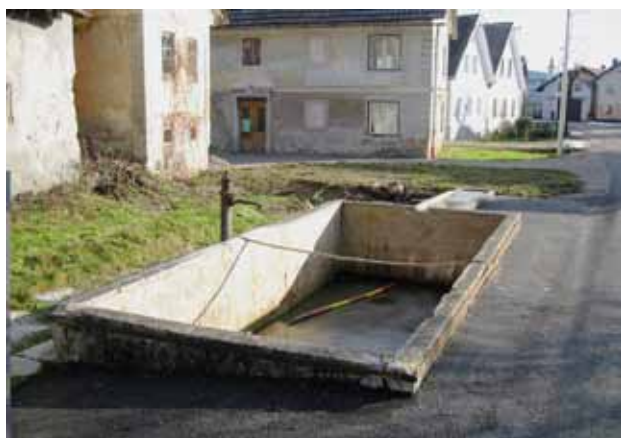
Nekoč ponos, zdaj sramota vasi