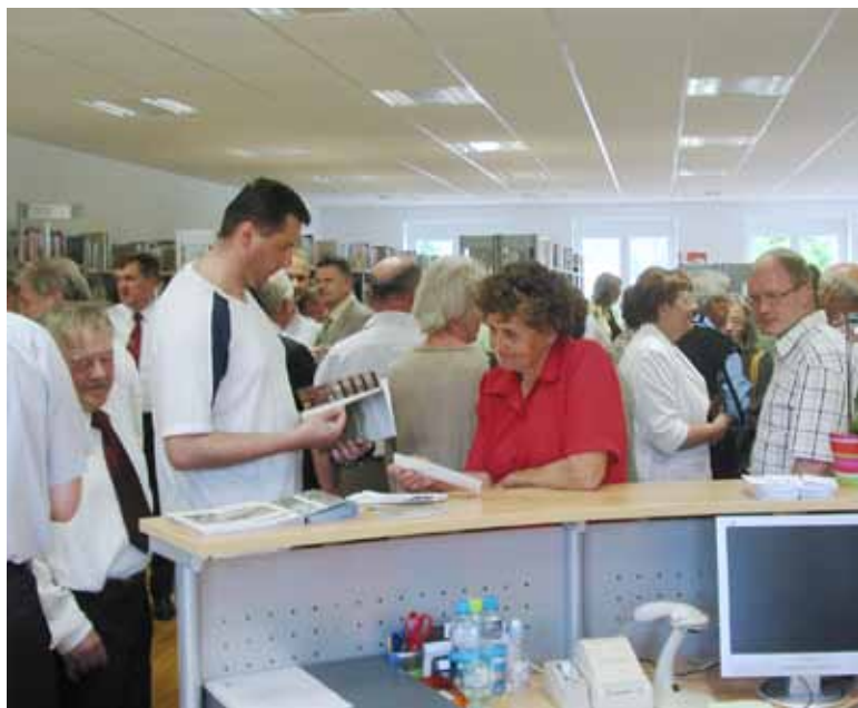
Na Blokah smo dočakali tudi hram znanja

Ena izmed najpomembnejših nalog lokalne skupnosti je zagotavljanje ugodnih pogojev za razvoj gospodarstva. Z intenzivnim razvojem komunalne in druge infrastrukture na področju celotne občine Bloke, ki sem jo opisal, smo poskrbeli tudi za ugodne pogoje, ki omogočajo nad-