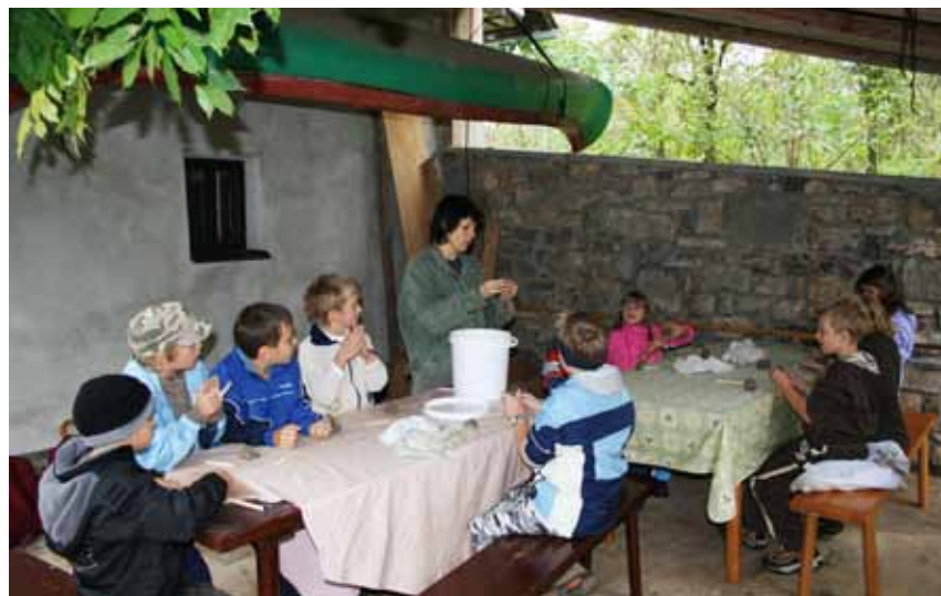
Učenci 3. razreda so zavzeto sledili razlagi in prikazu izdelave posodice