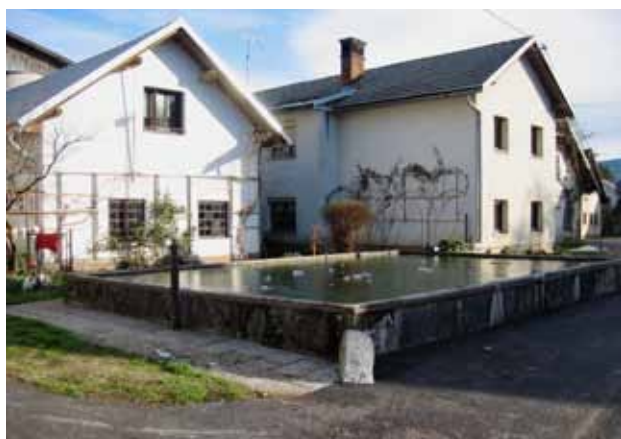
Voda je neprekinjeno tekla vse do letošnjega poletja

Mlad človek si težko predstavlja, da so bila še pred devetdesetimi leti vaška korita s tekočo vodo edini vir preskrbe z vodo. Studenec je bil speljan po lesenih ali po litoželeznih ceveh do izliva – tudi brez pipe. Sveža voda je tekla v korito, ki je bilo kamnito, betonsko, največkrat pa leseno, in je služila za napajanje živine. Danes se tudi domačim živalim v urbanem svetu ni potrebno sprehoditi do korita, saj je avtomatični napajalnik kar zraven. Pa tudi romantične prizore nošenja vode na glavi vidimo le v filmih ali na posnetkih iz nerazvitega sveta.