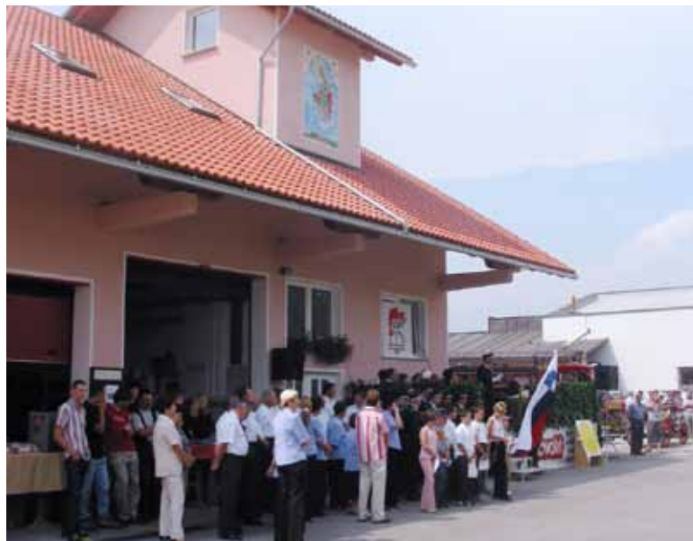
Gasilci in širša skupnost so dobili nov dom

aljnjo rast in razvoj obstoječega gospodarstva in drugih panog.