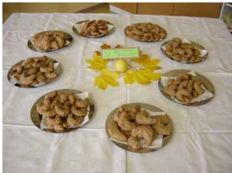
Mmm, piškoti so bili slastni.