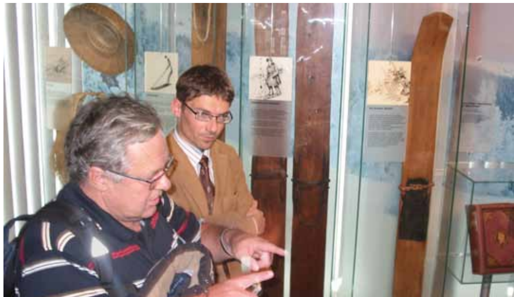
Bloška smučka in knjiga J. V. Valvasorja Slava vojvodine Kranjske sta nas pozitivno presenetili

V okviru projekta BLOSKI je turistično društvo Bloke v oktobru organiziralo strokovno ekskurzijo v Mürzzuschlag. Poleg članov turističnega društva so bili na pot povabljeni funkcionarji in predstavniki občine ter tudi predstavniki drugih društev z Blok, ki v svojih programih soustvarjajo smučarsko, turistično in športno zgodovino našega kraja. Glavni in edini namen je bil ogledati si, kako Avstrijci skrbijo za ohranjanje kulturne dediščine smučarskega športa.