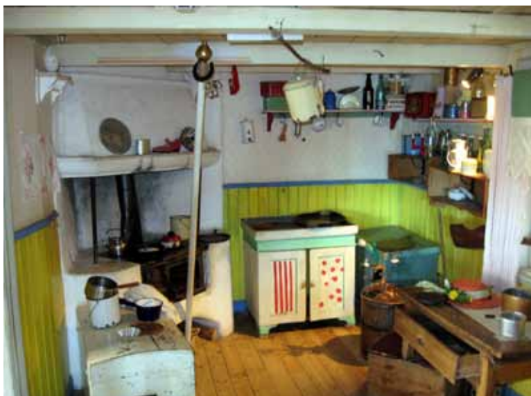
Kuhinja Pike Nogavičke

Na tem kratkem izletu pa nisem hodil naokrog le s kalkulatorjem. Bil sem tudi pravi turist, ki se podaja na izlete, koristi turistično infrastrukturo in ponudbo in tako dalje. Stockholm ima krasen izhod na odprto morje, na Baltik. Trajekti stalno vozijo na krajše in daljše razdalje; z ladjo se enostavno lahko podate na Finsko ali Poljsko in pri tem nočno vožnjo izkoristite še za brezcarinske nakupe alkohola – to ljudje često počno. Odločil sem se, da se podam