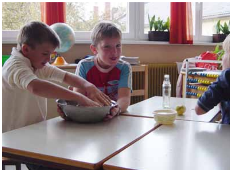
Jaka mesi testo, Jan pa se že oblizuje. Le kakšni bodo piškoti?