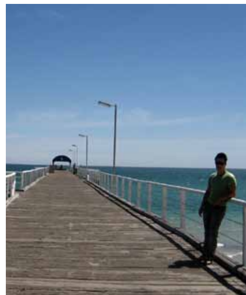
Henley Beach, obala ob mestu Adelaide.