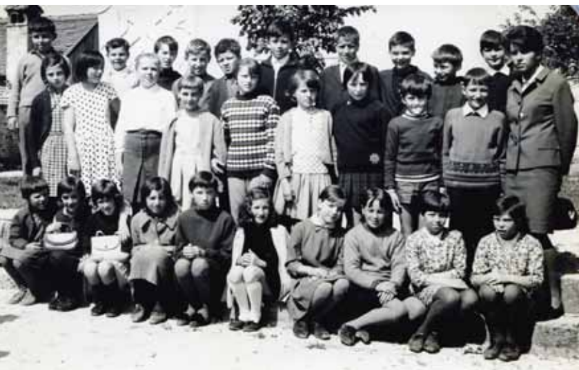
Prva generacija Tinčinih učencev na Blokah ...

Rojena na Rakeku je kar dobra štiri desetletja opravljala svoje delo v novovaški šoli; od prvega do zadnjega dne v isti službi. Pa v šolo v Novi vasi ni prvič vstopila kot učiteljica,