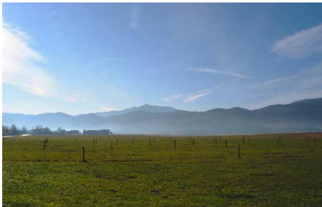
Kraljica nealpskih gora – bela gora ali Snežnik

Ljudje so ga kasneje različno imenovali, vendar ga je vedno spremljal pridevnik, da ga ne bi zamenjali z drugimi Snežniki, ki so v njegovi neposredni okolici. Naši pradedje so ga imenovali Bloški Snežnik (zelo nenatančno), kasneje Laški Snežnik (italijanski), zemljepisno je največkrat zapisan kot Notranjski Snežnik, oziroma bolj natančno Ilirskobistriški Snežnik.