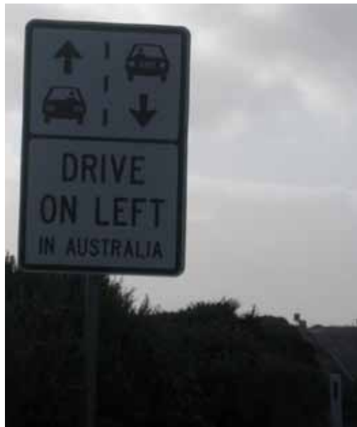
Prometni znak v Victoriji za tujce.

Oče je najprej delal v lesni industriji, mama pa se je kot medicinska sestra zaposlila v