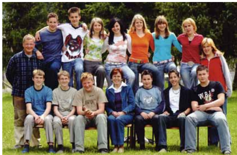
... in zadnja

Od 10. do 20. junija je občina organizirala Šolo v naravi na Debelem Rtiču za vse učence 4. razreda. Poleg plavanja in iger na prostem so imeli učenci še pouk SPN, da bi dobro spoznali naše morje in kraje ter živali našega Jadrana.