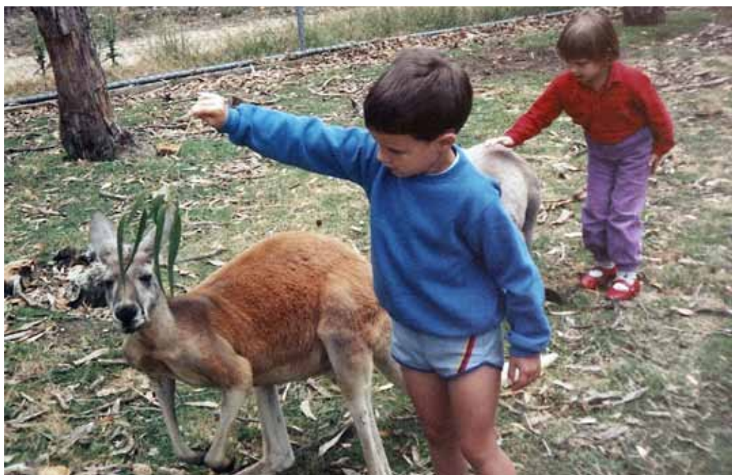
Avstralske domače živali.

Obmorsko mesto Adelaide leži na jugu Avstralije in je peto največje mesto na tem kontinentu. Ima 1,1 milijona prebivalcev, kar je polovico manj kot znaša celotna populacija v Sloveniji, in ima več kot 160 različnih narodnosti. V Avstraliji je Adelaide znano predvsem kot družinsko mesto. Mnogo delovnih mest prinaša gradbeništvo in rudarstvo. Glede na to, da je obmorsko mesto, ima tudi lepe plaže. Novembra in decembra, ko je na južni polobli poletje, se morski pes lahko približa obali. Za varnost je poskrbljeno tako, da vodno gladino opazujejo z letali. V primeru, če se morski pes preveč približa obali, opozorijo kopalce. Žrtev je zelo malo, lahko bi ga celo primerjali z medvedom na Blokah. Glede na to, da smo živeli dokaj blizu obale, cca 15 km stran, smo se večkrat popoldne s prijatelji odpravili lenarit na plažo. Ne znam pa si predstavljati, kaj bi delal en teden na morju, tako kot ima večina Slovencev navado, da si poleti privoščijo enotedenski ali pa celo daljši oddih na morju. V Avstraliji precej drugače pojmujejo preživljanje dopusta. Večkrat si ljudje vzamejo podaljšan vikend in se z avtom odpravijo v večja mesta, ribarit, kampirat ali pa na kakšen drugačen način izkoristijo proste dneve.