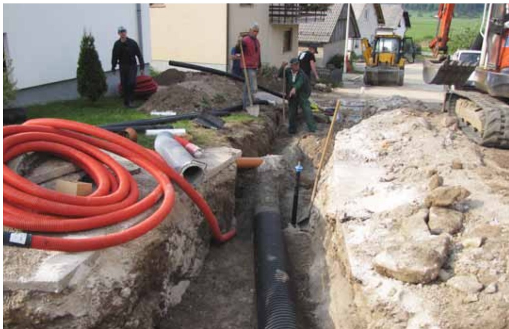
Izvajanje del na kanalizaciji v Nemški vasi.