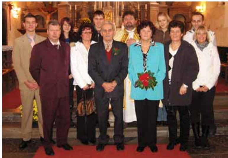
Zlatoporočenci v družbi domačih