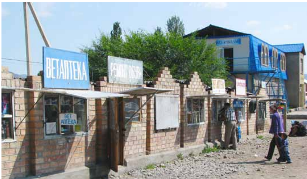
Lekarn je vsepovsod polno. Samo na tej sliki lahko vidimo dve.