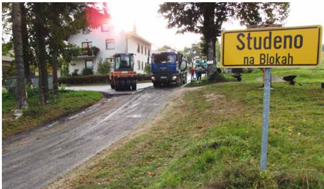
Asfaltiranje na Studenem.

Kljub temu, da zima že močno trka na vrata, dela na naših investicijah še naprej potekajo. Na projektu Okoljska infrastruktura Velike Bloke so izvršena potrebna rušitvena dela na čistilni napravi v Velikih Blokah in skladno s projektno dokumentacijo se že izvajajo sanacijska dela na tem objektu. Zgrajen je tudi nizkonapetostni zemeljski elektrovod do čistilne naprave. Če bodo vremenske razmere dovoljevale, bomo nadaljevali z gradbenimi sanacijskimi deli na čistilni napravi, montažna dela pa bomo izvajali v pomladanskem času.