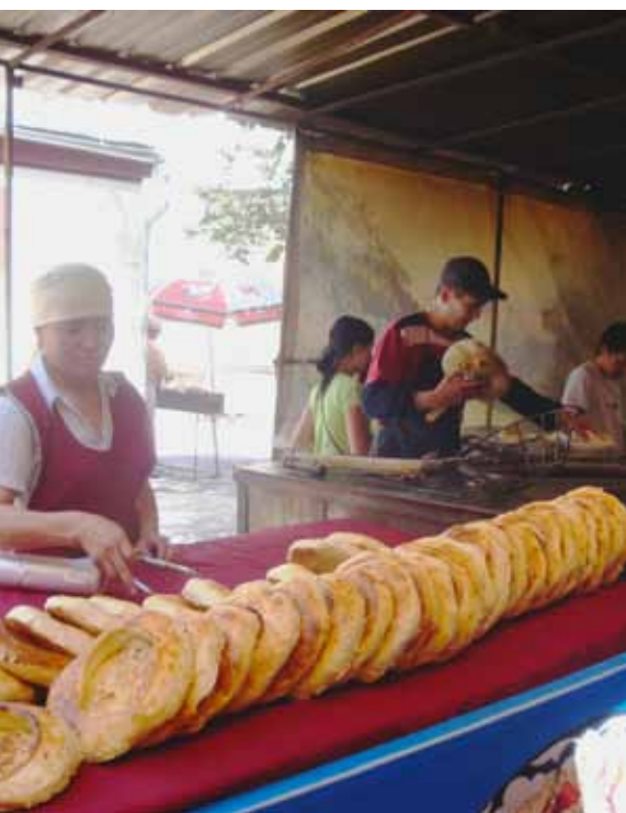
Peka kruha na tržnici

svoje črede. V hribih na svoj način krojijo kože in pridelujejo različne mlečne izdelke. Najbolj tipični so »kymyz« – fermentirano konjsko mleko, »airan« – neke vrste razredčen jogurt, malce kiselkastega okusa, »kurut« – posušene slane jogurtove/sirove kroglice (meni osebno niso šle dobro po grlu, so pa pri njih zelo priljubljene in jih je dobro jesti predvsem poleti, saj se z njimi dobro nadomesti zaradi pomanjkanja izgubljene elektrolite) in »kaymak« – kiselkasta smetana iz navadno prekuhanega ovčjega mleka, ki jo uporabljajo tudi kot maslo. Čez zimo pa se ti ljudje vrnejo v svoje preproste domove po vaseh.