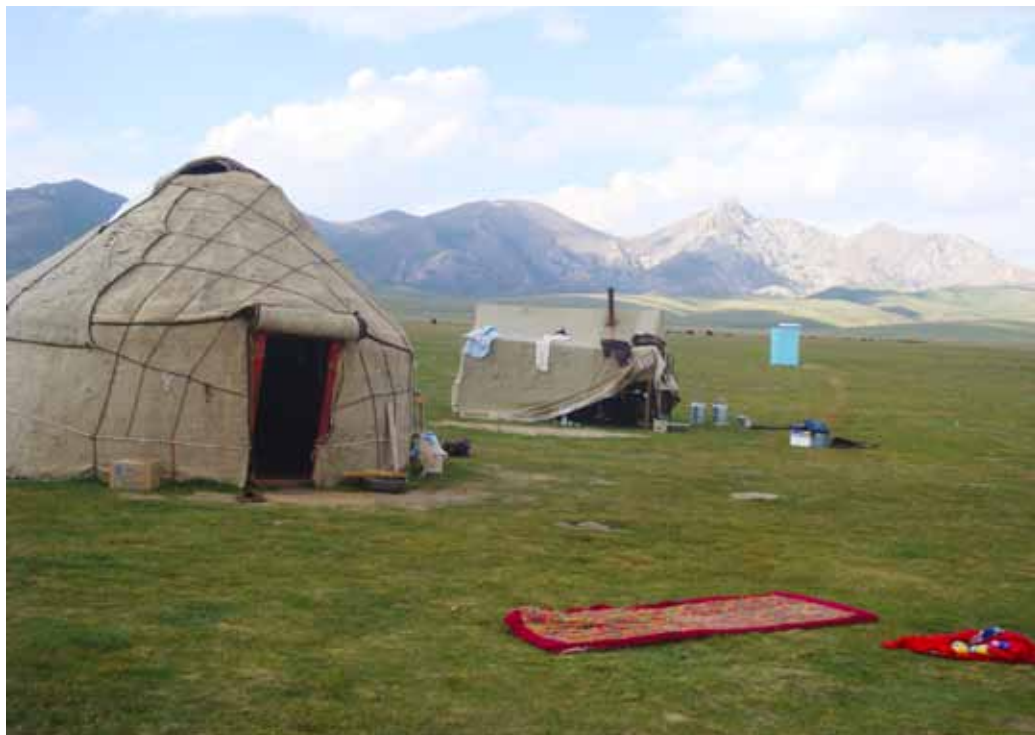
Jurte v hribih Song Kul