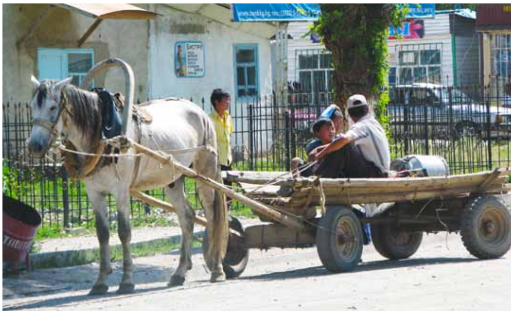
Še vedno pogosto prevozno sredstvo