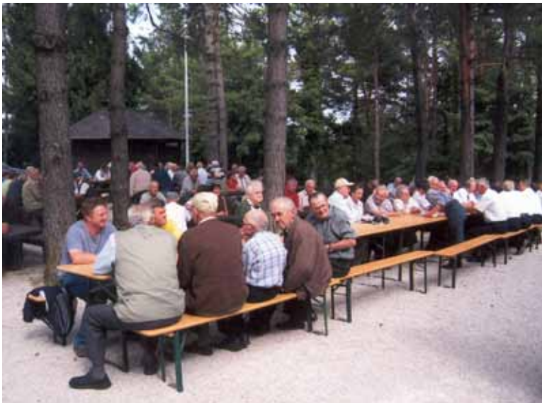
Eno izmed veteranskih srečanj gasilcev pri lovski koči v Zelšah

Komisija za veterane pri Gasilski zvezi Cerknica je letos že desetič organizirala srečanje skupaj z vsemi gasilskimi društvi (18), ki delujejo na področju Gasilske zveze Cerknica. Vsako leto se konec avgusta zbere preko 200 gasilskih veteranov. Do sedaj so veterani gostovali v sledečih PGD: Sveti Vid, dvakrat Cerknica, dvakrat Unec, Nova vas, Velike Bloke, Ivanje selo, Grahovo in letos Dolenja vas (28. 8. 2011). Za prihodnje leto je že določeno oziroma dogovorjeno, da bo to srečanje v Begunjah. Na teh srečanjih je organizirano tudi gasilsko športno tekmovanje. Ekipa veteranov iz Unca je letos nastopila na tek-