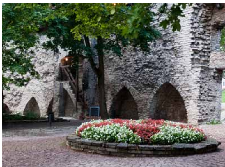
Mesto, kamor naj bi božanstva poslala daneborg, osnovo za najstarejšo, dansko zastavo.