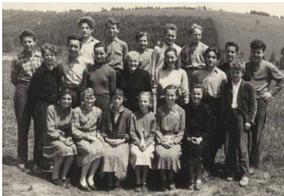
3. razred 1955/56

Zaradi odsotnosti tov. Žurgove sta imela 2. in 3. razred pouk vsak drugi dan, četrti dan pa telovadbo in pisanje. Ako bi imeli še eno učiteljico, bi bil pouk reden. Tako pa sta ta dva razreda imela skrčen pouk in nastali so zaostanki v snovi, kar se bo poznalo drugo leto.