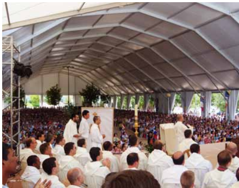
Maša v Toledu

Naslednje jutro smo se zbudili nedaleč stran od Madrida, v bližnjem mestecu Toledu. Tam so nam pripravili čudovite tedenske duhovne vaje, ki jih je organizirala