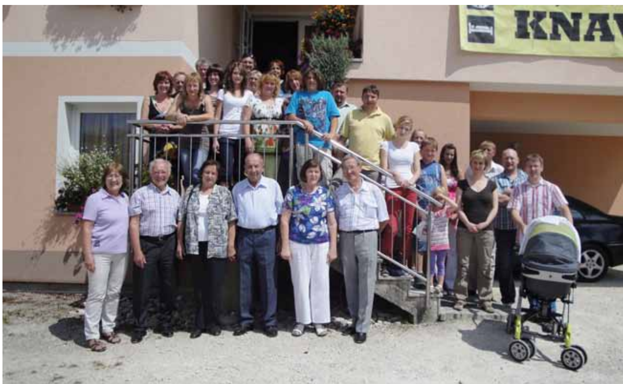
Srečanje rodbine Suhadolnik na Runarskem, avgust 2011