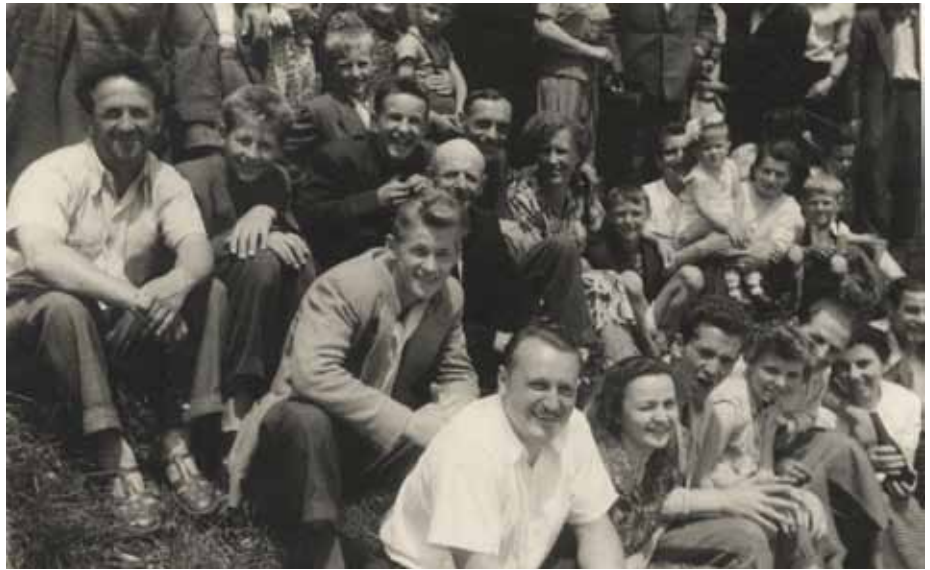
Bločani ob odkritju spomenika na Radleku

Učni načrti so bili isti – a so jih razredniki tekom leta dopolnjevali ali pripisovali pripombe k posameznim