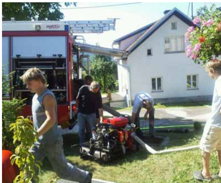
Obnovljena črpalka za vodo, Rosenbauer