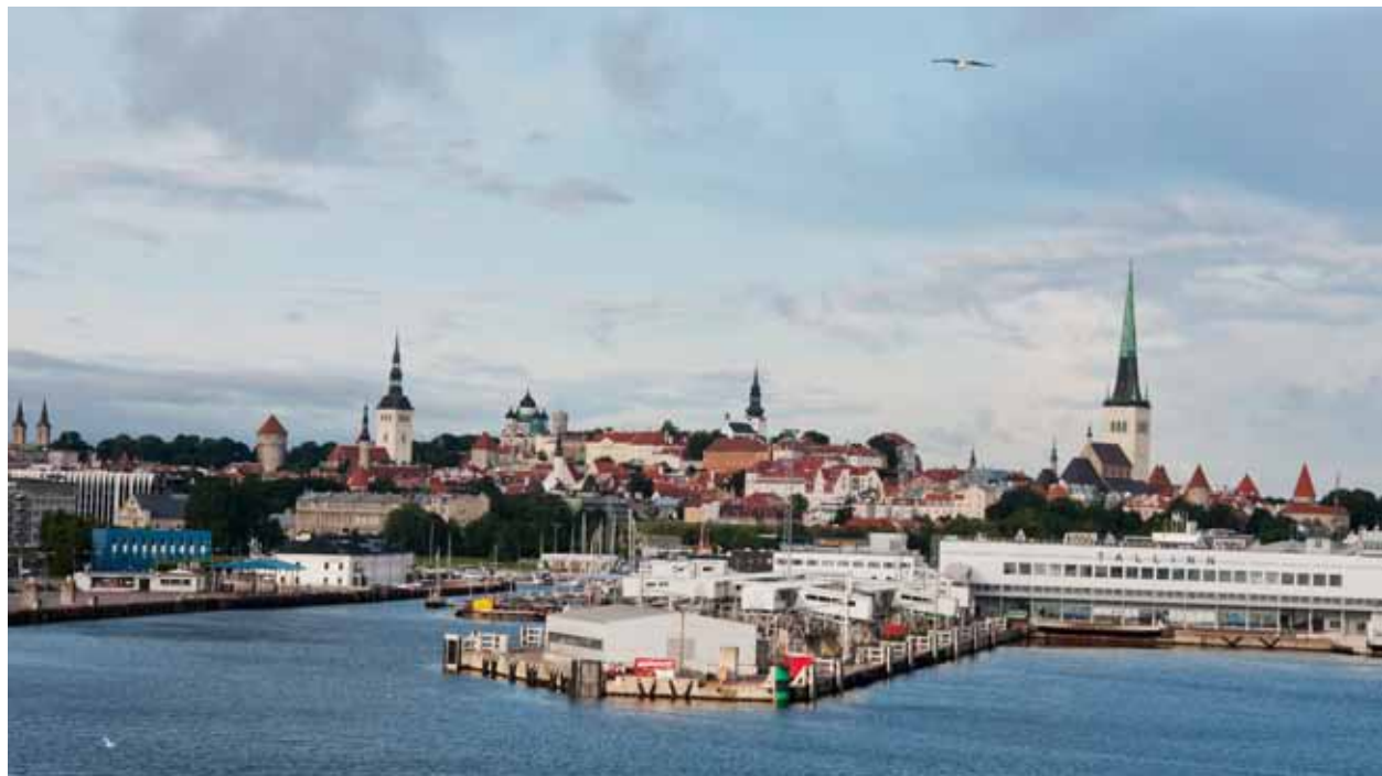
Pogled na staro mestno jedro z morja – zvonik katere cerkve je najvišji?

V središču mesta je zanimiva še ena cerkev, to je cerkev sv. Olafa. V srednjem veku je bila to najvišja stavba na svetu, v višino je merila 159 metrov. Legenda pravi, da je bil Talin pomembno trgovsko