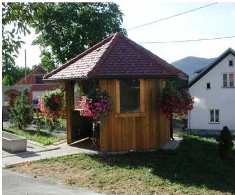
Nov paviljon v vašem središču – mesto za druženje

bo šopek diplomantk, hiše pa so vse bolj prazne. Kljub vsemu naštetemu pa v vasi že dolgo ni bilo tako živahno. Delovne akcije se vrstijo ena za drugo, ureja se središče vasi, posodablja se infrastrukturo. Julija se je zgodil velik dogodek, saj se je čistilo vodohran v središču vasi. Nihče sicer nima natančne informacije, kdaj je bil nazadnje izprazen in očiščen, predvideva pa se, da je bilo to po velikem vaškem požaru. Vodohran je ogromen. V globino meri kar 12 metrov in je ovalne zasnove, prostornina je nekje med 260 in 300 tisoč litri. Pri čiščenju so izdatno pomagali novovaški gasilci z znanjem in opremo, preizkusili so tudi popolnoma obnovljeno vodno črpalko. Dela je bilo za dobre tri dni in hvaležni smo jim. Na presenečenje vseh je bil vodohran zelo čist, saj ni bilo nikjer