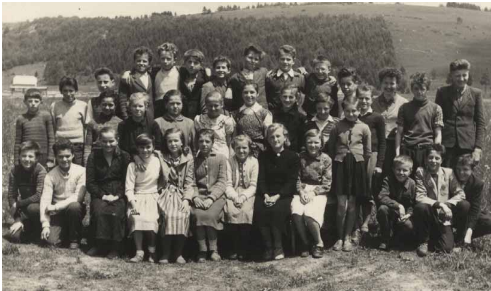
1. razred 1955/56