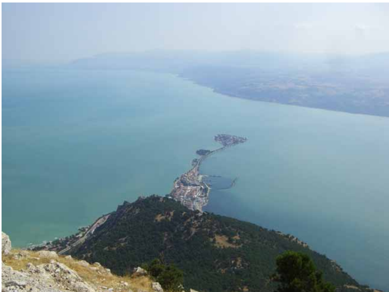
Razgled iz gore Sivri Dag