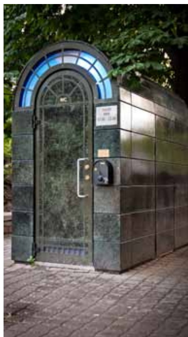
Prestizna nepremičnina, javno stranišče za milijon.

ni iz marmorja in zlata, je zgolj navadno stranišče. Drugi vzdevek je najcenejši hotel v Talinu, saj na začetku ni imel sistema za samodejno odklepanje. Brezdomci so torej porabili tistih nekaj kron, da so lahko vstopili v WC, tam pa so se zadržali vso noč – pravzaprav so spali v razkošni nepremičnini, kar je bilo posebej priročno v zimskem mrazu.