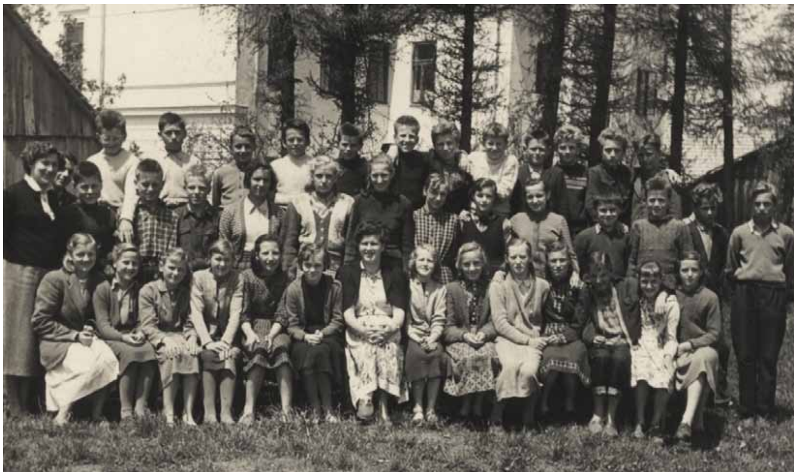
2. razred 1955/56