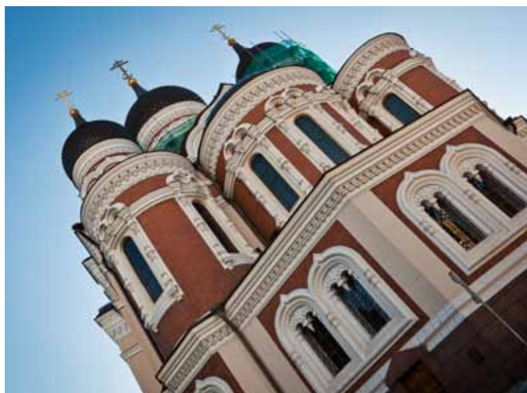
Ruska pravoslavna cerkev Aleksandra Nevskega, ki naj bi se zaradi uroka podrla.