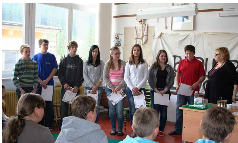
Letošnji zlati bralci