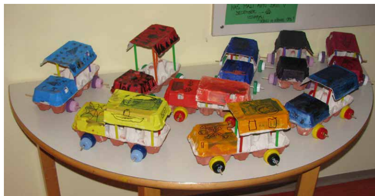
Izdelek učen in učencev OPB 1: dirkalni avto

Letošnje leto je bilo polno dogodivščin za učence in učenke oddelka podaljšanega bivanja, saj so sodelovali v različnih natečajih in projektih: risali so za natečaj Jolly-jev domišljjski podvodni svet, v okviru ekošole so risali vse, kar je mogoče narediti iz odpadne konzerve in plastike, ter skrbeli za rastline, ki krasijo naš šolski vrtiček.