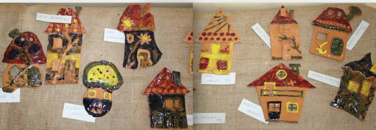
Keramične hišice, 8. r.

DEČEK Z VZDEVKOM PREKLA Nekoč je živel deček, ki so ga klicali Prekla. Imel je čarobno kroglo in orglice, ki jih je ob koncu igranja vedno pridno pospravil v škatlo. Nekega dne so bile v tistem kraju olimpijske igre.