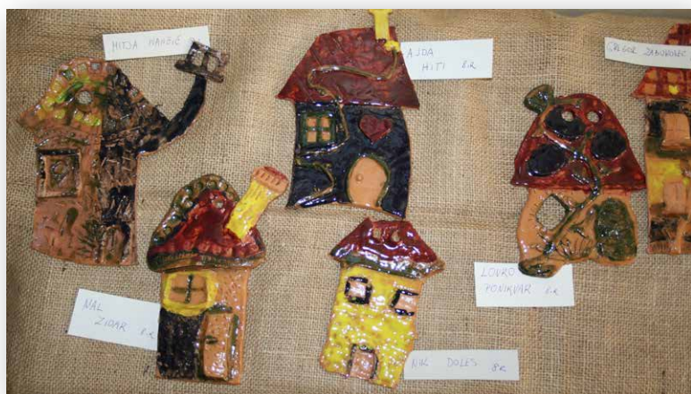
Keramične hišice, 8. r.

ga že ustrašili, ko so ga videli. Ko pa je začel metati kamne, so se vrešče razbežali, saj so bili ranjeni in prestrašeni. Kmalu so se ljudje začeli zbirati na ulicah in se veselili, da je mesto rešeno.