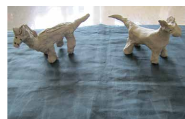
Živali iz gline