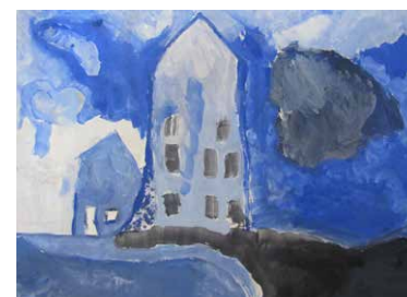
Mesto – hladne barve