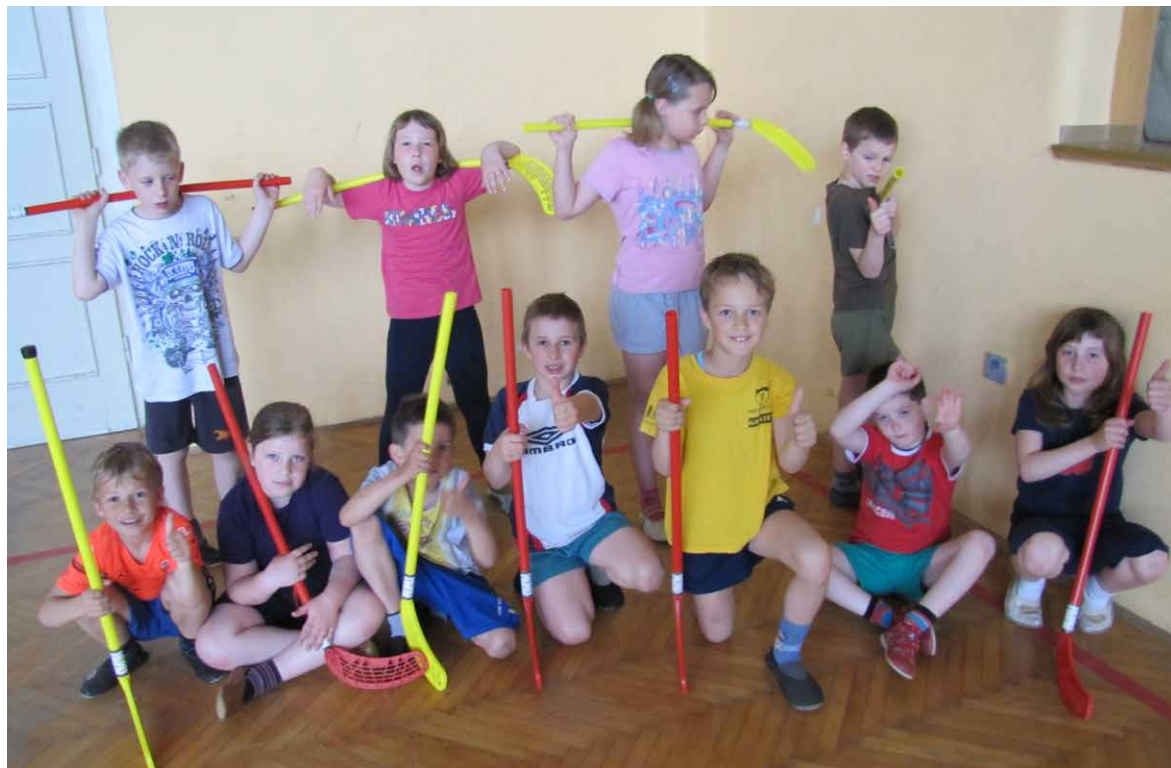
Hokejska ekipa iz 2. razreda