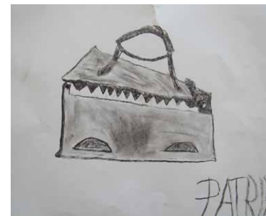
Risba z ogljem