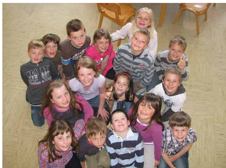
Učenci in učenke OPB 1

Trenutno se ukvarjamo z natečajem, ki ga je razpisala revija Unikat. Končni izdelek bo krasil naš hodnik v mesecu juniju. Z učenci upamo, da bomo izbrani in objavljeni v reviji. V mesecu juniju nas čaka še zadnja dogodivščina, in sicer zaključni piknik, ki bo namenjen učencem OPB 1. V šolski kuhinji bodo sami poskrbeli za prigrizke.