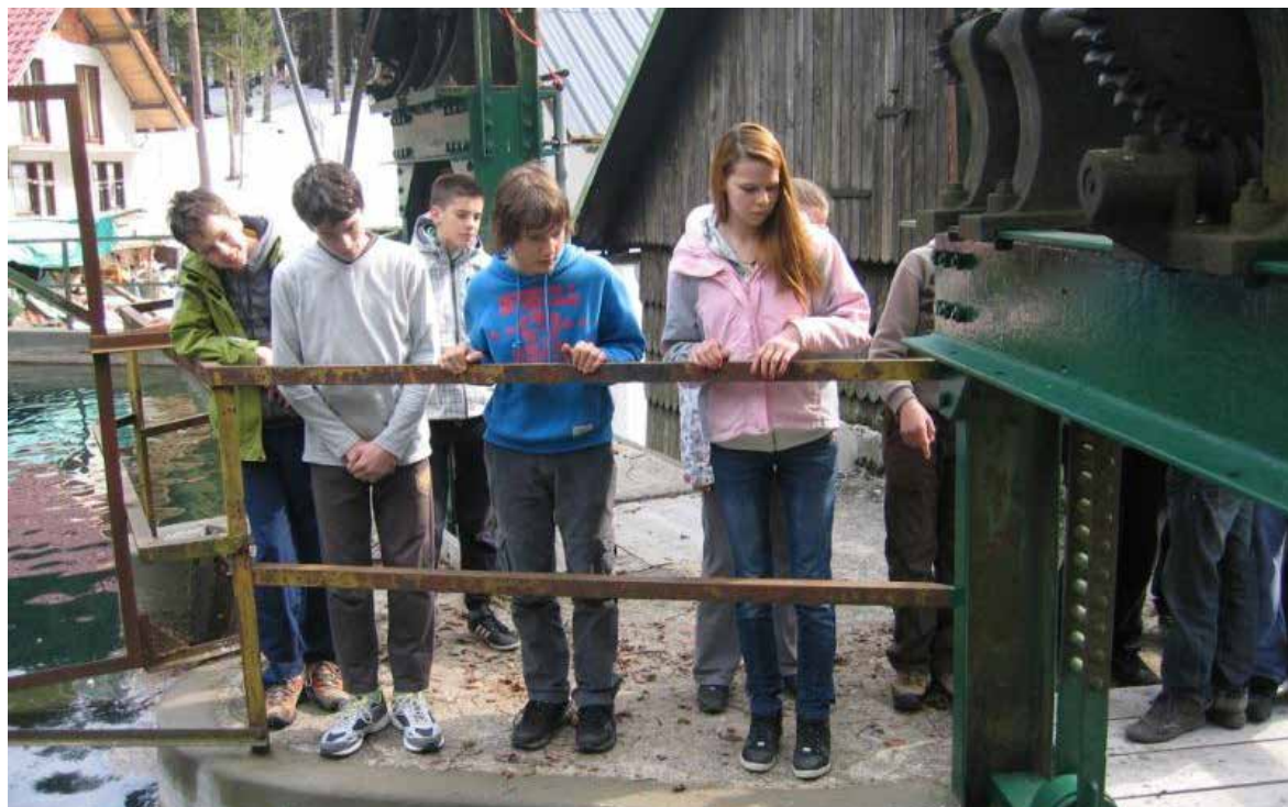
HE Javorniški Rovt čaka na odjemalce elektrike.