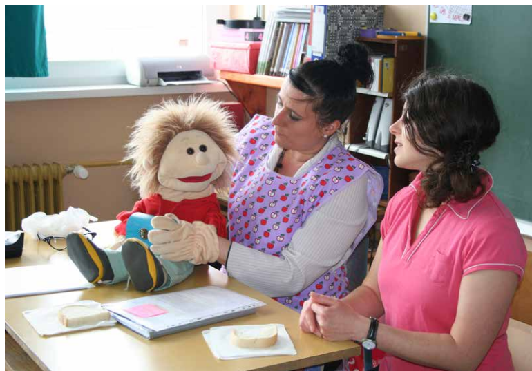
Tonka Bontonka se uči lepega vedenja.