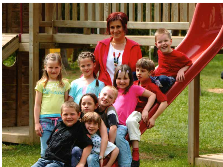
Devetarji v 2. razredu