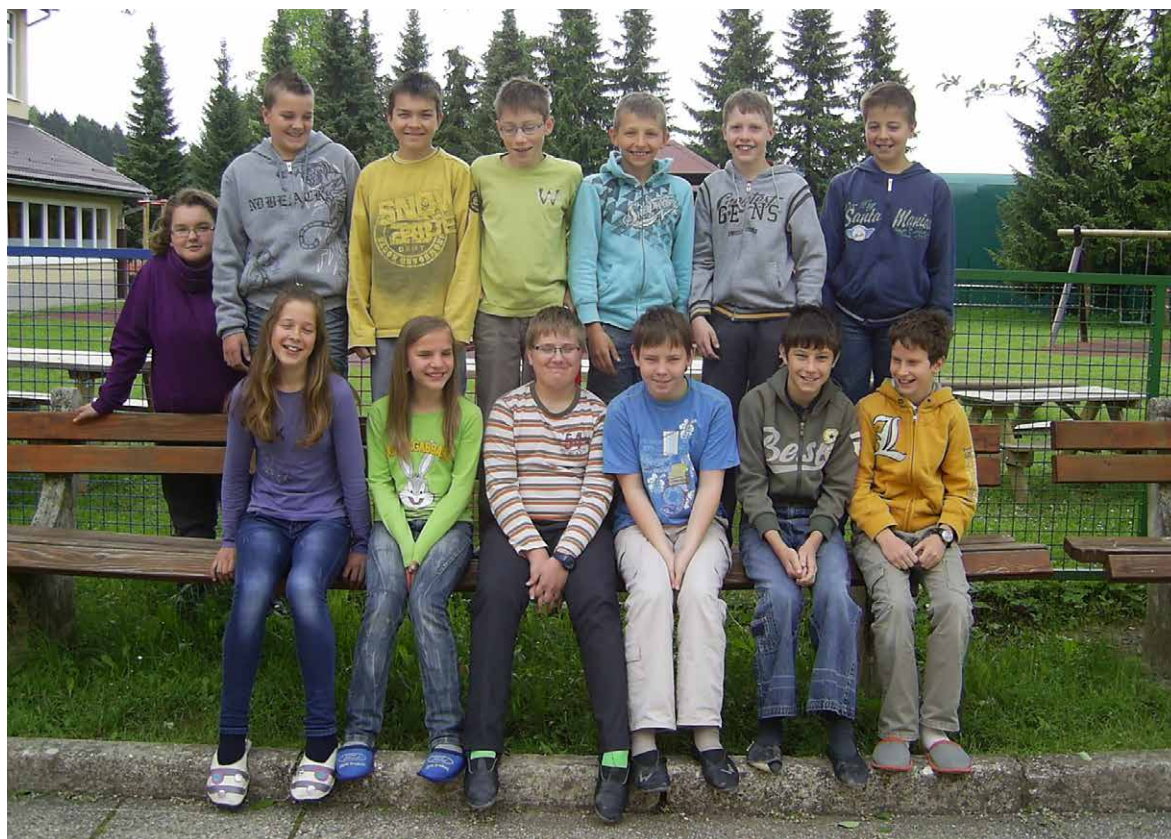
Veseli v pričakovanju počitnic