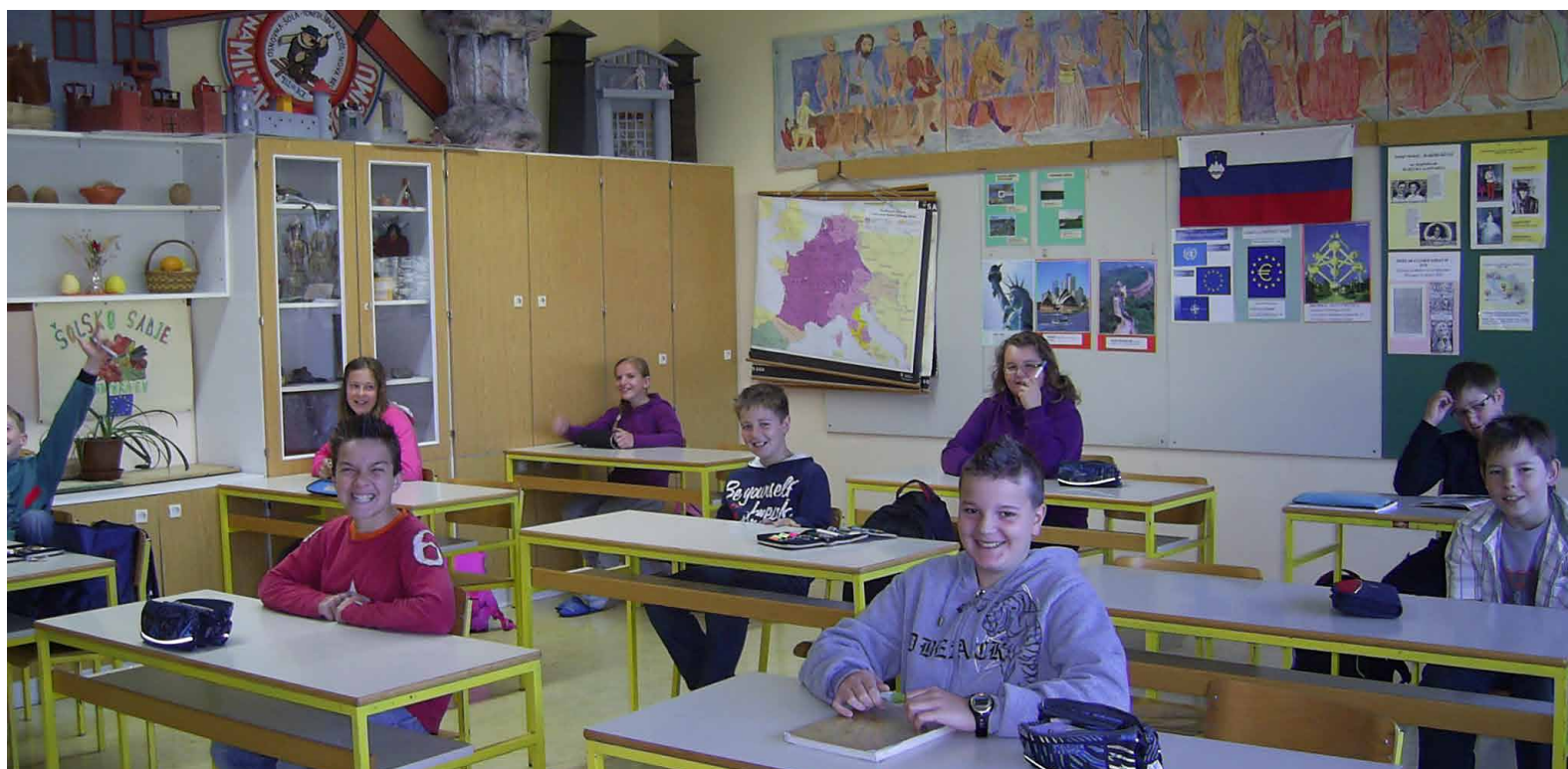
V šestem razredu pred kontrolno nalogo