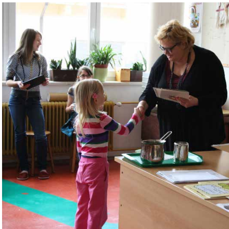
Priznanja tudi za otroke iz vrtca