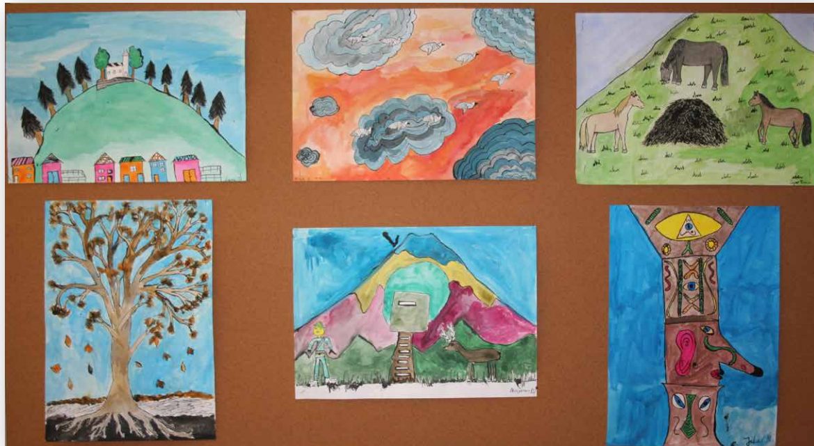
Kompozicija, 7. r.