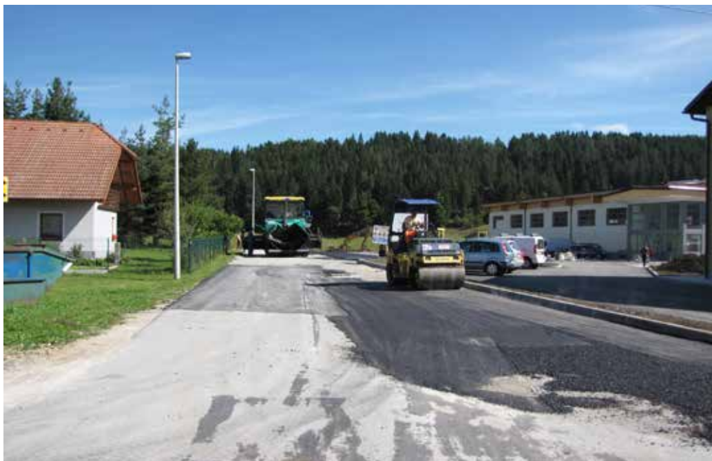
Izvajanje asfalterških del.

naselja Pajkovo in Sv. Urha, kjer bo lociran tudi dodatni rezervoar. Z izgradnjo tega vodovodnega omrežja bomo na centralni vodovod Bloke priključili še zadnji dve naselji, ki trenutno te možnosti še nimata – naselji Polšeče in Zavrh. Prebivalci teh dveh naselij so se s pitno vodo do sedaj oskrbovali iz vodovoda Sv. Vid iz občine Cerknica. Voda iz omenjenega vodovoda pa je žal večkrat zdravstveno oporečna, velike težave, predvsem v poletnih mesecih, pa so tudi z izdatnostjo vodnega vira, zato je oskrba večkrat motena. Zaradi organizacijskih razlogov se izgradnja tega vodovoda še ni začela, kljub temu pa sem prepričan, da bo tudi ta projekt dokončan še letos.