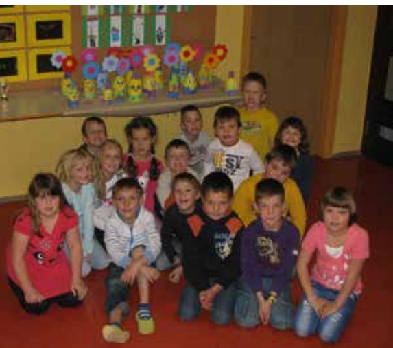
Učenci z nagrajenimi izdelki Unikatovega natečaja Pravi gospod

Tudi v letošnjem šolskem letu smo se v podaljšanem bivanju trudili čas izkoristiti kar se da ustvarjalno, pa vseeno igrivo in sproščeno. Poleg risanja in barvanja smo veliko časa namenili gibanju in plesu ter poslušanju glasbe in petju. Z našimi izdelki smo se zelo uspešno udeleževali različnih projektov in natečajev.