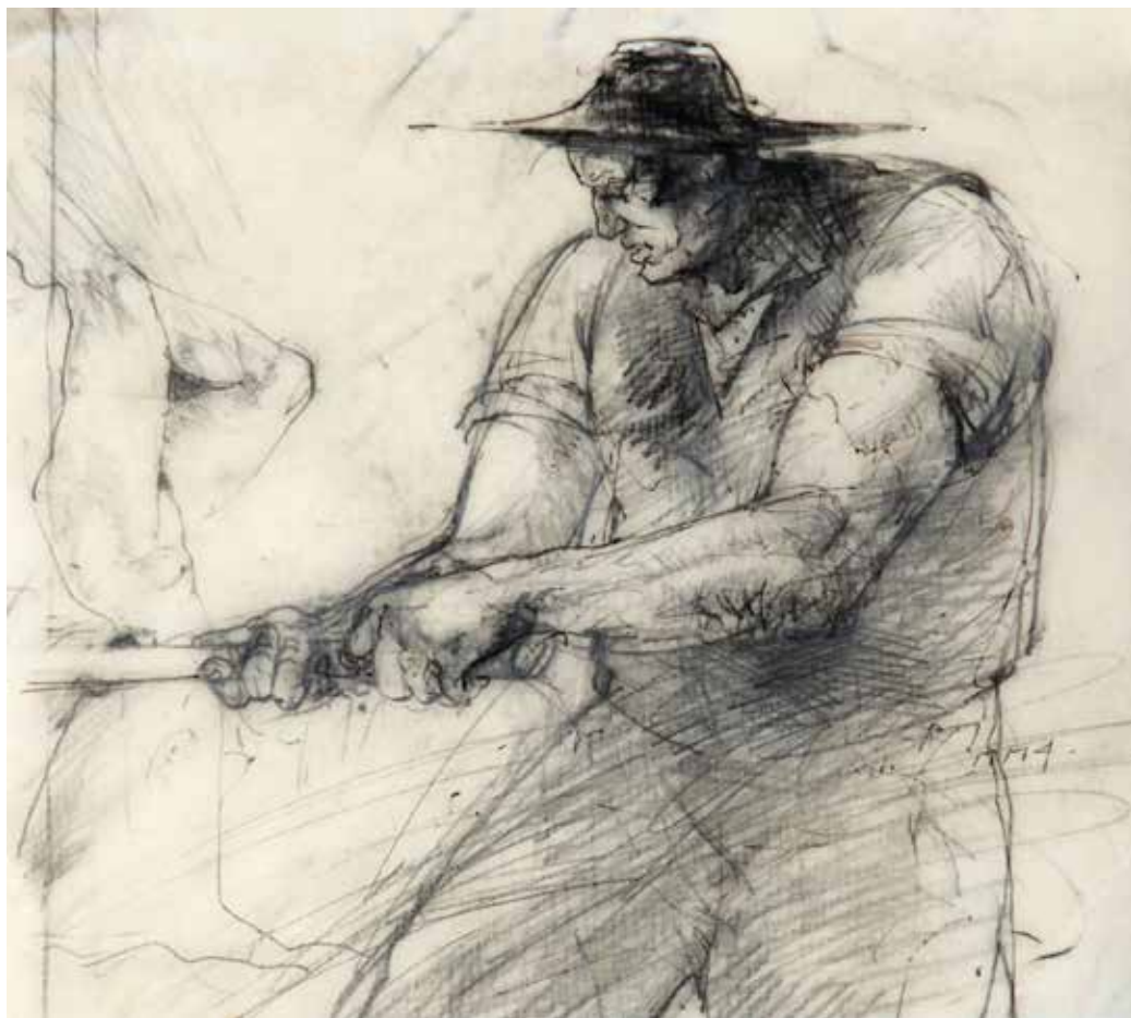
Krpan, 2004, svinčnik, 20 x 22 cm

Motivno izhodišče za njegovo ustvarjanje predstavlja prav življenje na Bloški planoti, ki s svojo umirjeno pokrajino in ostrim podnebjem od tamkajšnjih ljudi zahteva, da ji prilagodijo ritem svojega vsakdana. Največji del njegovega opusa risb in grafik predstavljajo žanrski prizori, predvsem upodobitve kmečkega dela, ki ga bolj kot orodje preživetja