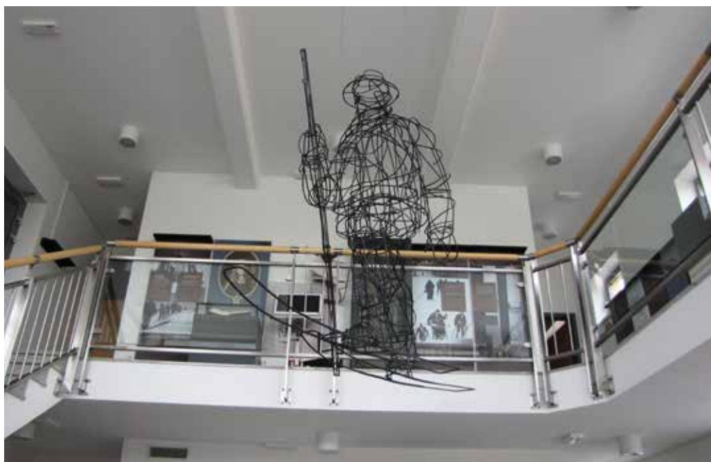
Bloški smučar na častnem mestu

ČAS HITRO BEŽI IN ŽE SMO SREDI LETA, KI JE ZA NAS ZOPET NADVSE RAZGIBANO IN DINAMIČNO. V PREJŠNEM GLASILU SMO PISALI O NEPOTREBNEM ZAPIRANJU POSLOVALNICE NOVE LJUBLJANSKE BANKE. TA ODLOČITEV NAM NI VZELA OPTIMIZMA, ŠE Z VEČJO ZAGANOSTJO SMO SE NAMREČ LOTILI REALIZACIJE ŠTEVILNIH NOVIH PROJEKTOV.