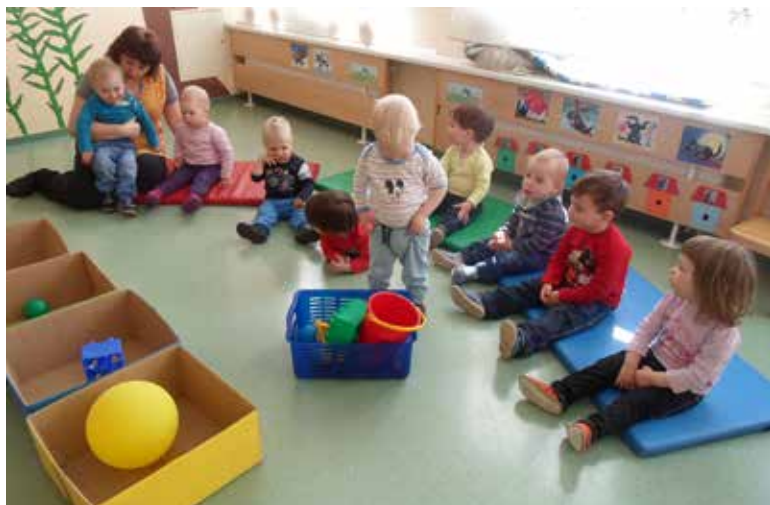
Spoznavamo barve.