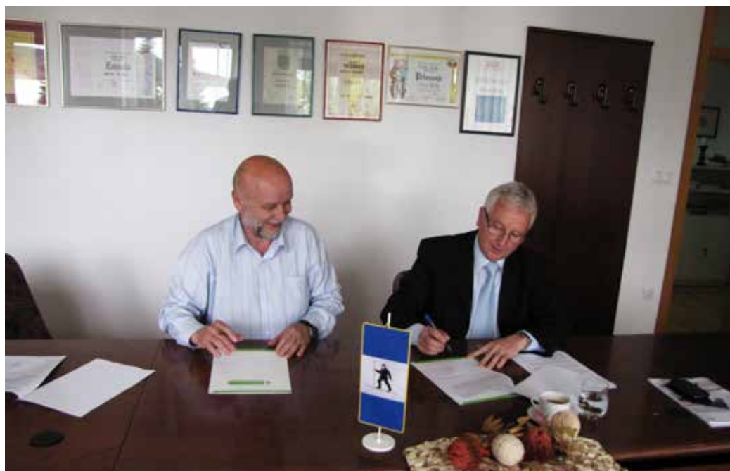
Župan občine Bloke in direktor Lekarne Ljubljana podpisujeta pogodbo za lekarno v Novi vasi.

Z Lekarno Ljubljana je že dogovorjen termin odprtja teh prostorov. To se bo zgodilo 10. julija ob 17. uri. Lekarna bo predvidoma delovala v vseh delovnih dneh od ponedeljka do petka, in sicer poln delovni čas. Poleg zdravil in drugih medicinskih pripomočkov, ki se izdajajo na recept, naj bi bila dobro založena