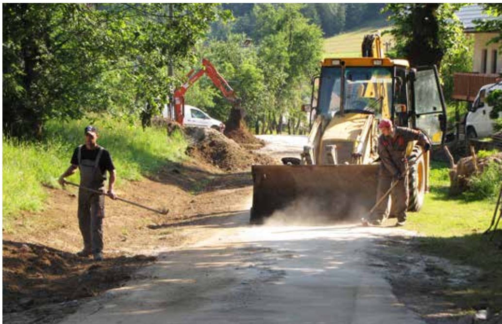
Izgradnja okoljske infrastrukture v Metuljah