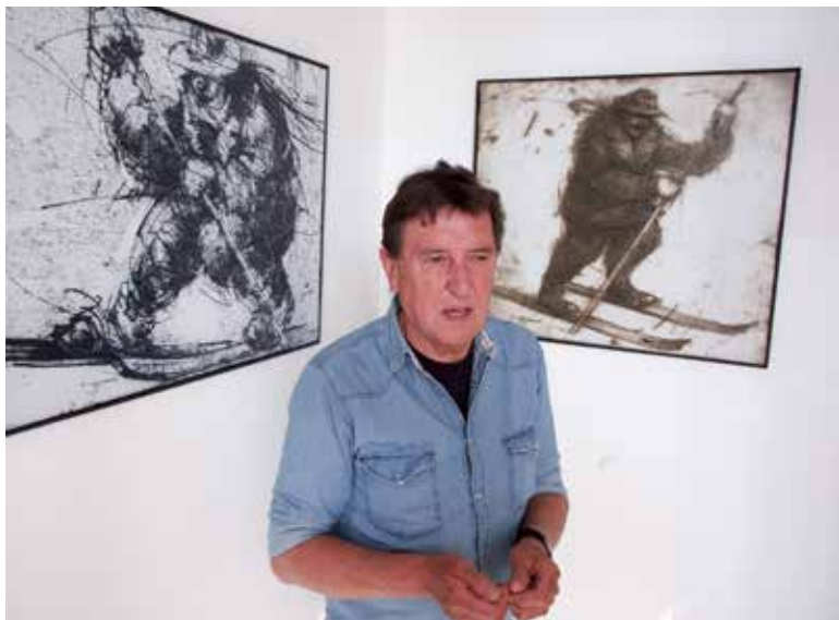
Za scensko likovna dela in skulpturo bloškega smučarja je poskrbel Božidar Strman - Mišo.

prispevale svoj delež k umiku bloškega smučanja s prevzemom sodobnejših načinov smučanja.