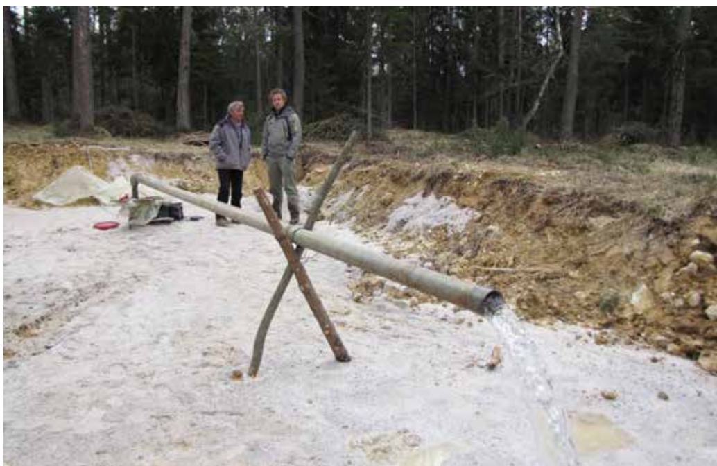
Pri novi vrtini v času črpalnega poizkusa