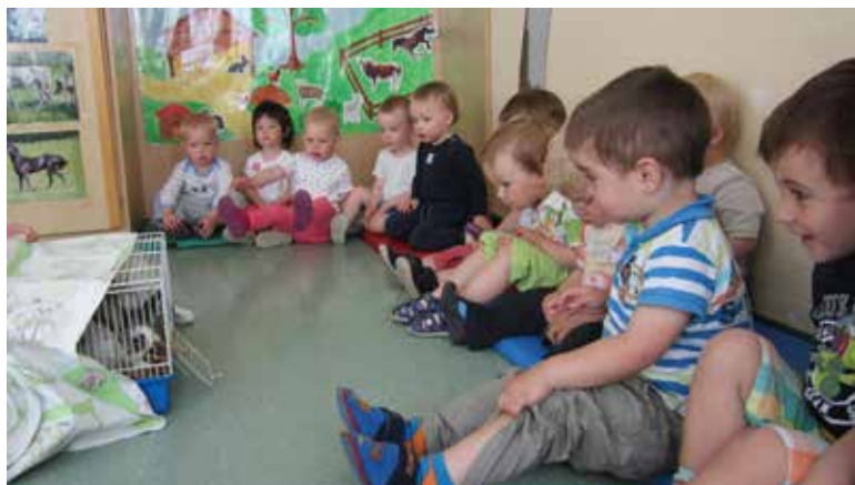
Obiskal nas je zajček.