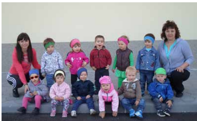
To smo me — PIKAPOLONICE.