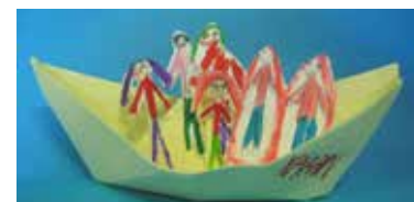
Gubanje papirja. Koga smo povabili na zlato ladjo? Vse, ki jih imamo radi. (Avtor: ica: Karin Bačnik, 1.r.)