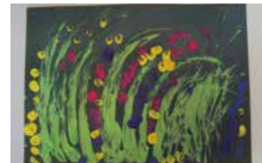
Travniki: slikanje s prstki - na prostem (Avtor: Andraž Štrukelj, 1.r.)